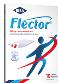
FLECTOR 180 mg 10 cerotti medicati