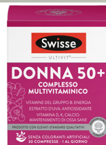
SWISSE MULTIVITAMINICO • Donna 50+ 30 compresse • Uomo 50+ 30 compresse