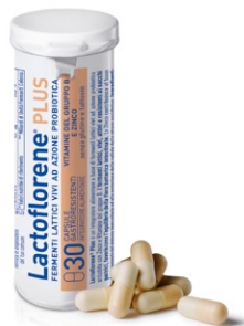
LACTOFLORENE PLUS 30 capsule