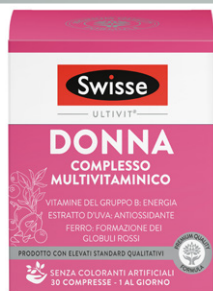
SWISSE MULTIVITAMINICO DONNA 30 compresse