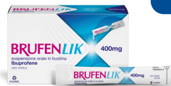
BRUFENLIK 400 mg 20 bustine da 10 ml