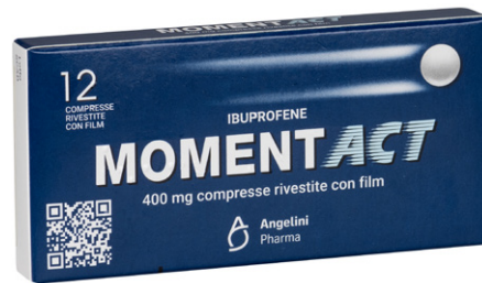
MOMENTACT 400 mg 12 compresse rivestite