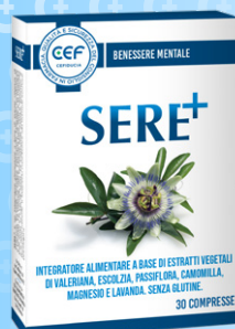
SERE+ CON ESTRATTI DI VALERIANA, PASSIFLORA 30 compresse

CONTINUA LA PROMOZIONE DI DICEMBRE VALIDA FINO AL 31 GENNAIO 2025