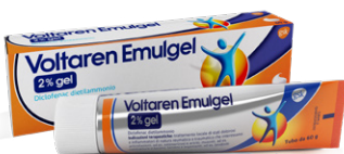
VOLTAREN EMULGEL 2% gel tubo da 60 g