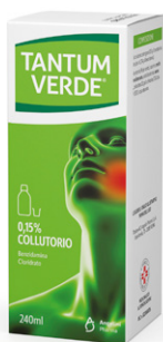
TANTUM VERDE 0,15% COLLUTORIO 240 ml