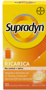
SUPRADYN RICARICA 30 compresse effervescenti