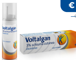
VOLTALGAN 3% SCHIUMA CUTANEA 50 g