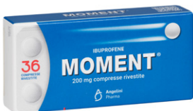
MOMENT 200 mg 36 compresse rivestite