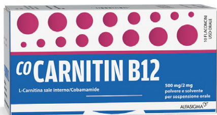
COCARNITIN B12 500 mg/2 mg 10 flaconcini da 10 ml