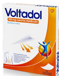
VOLTADOL 140 mg 10 cerotti medicati