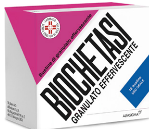
BIOCHETASI GRANULATO EFFERVESCENTE 18 bustine uso orale