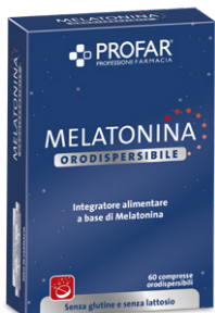
MELATONINA ORODISPERSIBILE 60 compresse

CONTINUANO LE PROMOZIONI DI OTTOBRE VALIDE FINO AL 30 NOVEMBRE 2024