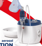
AIR FAMILY EVOLUTION aerosol