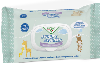
SEMPRE ASCIUTTO 72 salviette detergenti