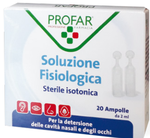
SOLUZIONE FISILOGICA ISOTONICA 20 ampolle da 2 ml