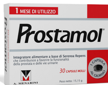
PROSTAMOL 30 capsule molli