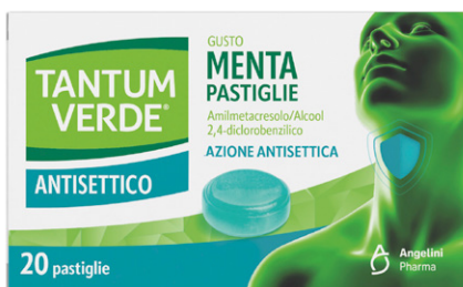
TANTUM VERDE ANTISETTICO 20 pastiglie gusto menta