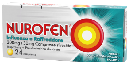
NUROFEN INFLUENZA E RAFFREDDORE 200 mg + 30 mg 24 compresse rivestite