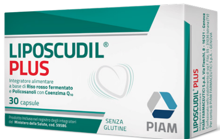
LIPOSCUDIL PLUS 30 capsule