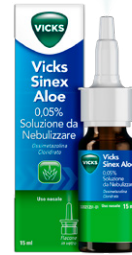
VICKS SINEX ALOE 0,05% SOLUZIONE DA NEBULIZZARE 15 ml