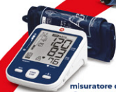
misuratore di pressione OneRAPID