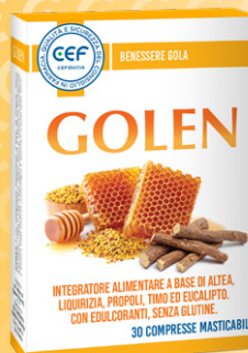
GOLEN ADULTI 30 compresse masticabili