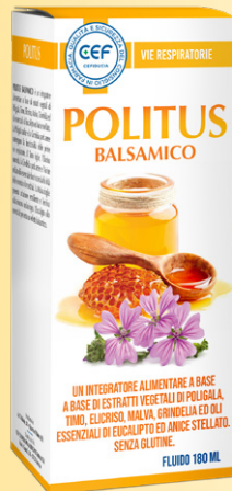
POLITUS BALSAMICO 180 ml