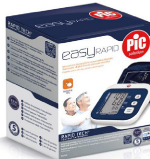
EASYRAPID Misuratore di pressione