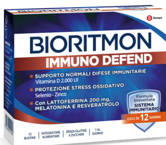
BIORITMON IMMUNO DEFEND 12 bustine