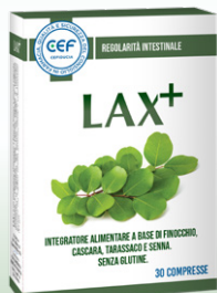
LAX+ 30 compresse