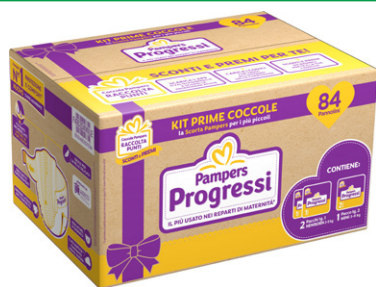
PAMPERS KIT PRIME COCCOLE 2 pacchi Progressi NEWBORN tg. 1 + 1 pacco Progressi MINI tg. 2 - 84 pannolini