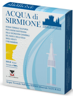
ACQUA DI SIRMIONE ACQUA TERMALE SULFUREA 6 flaconcini da 15 ml