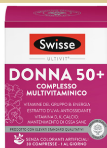
SWISSE MULTIVITAMINICO • Donna 50+ 30 compresse • Uomo 50+ 30 compresse