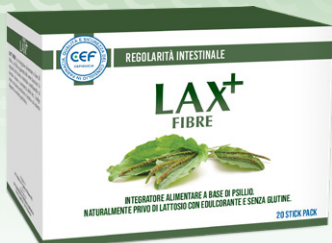
LAX+ FIBRE 20 stick pack