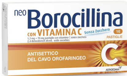
NEOBOROCILLINA CON VITAMINA C 1,2 mg + 70 mg 16 pastiglie senza zucchero