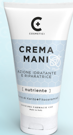
CREMA MANI NUTRIENTE 75 ml