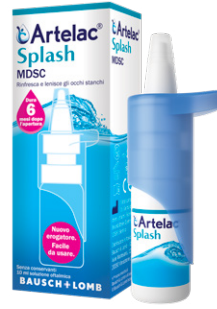
ARTELAC SPLASH MULTIDOSE 10 ml soluzione oftalmica