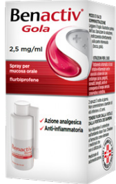
BENACTIV GOLA 2,5 mg/ml SPRAY 15 ml

CONTINUA LA PROMOZIONE DI OTTOBRE VALIDA FINO AL 30 NOVEMBRE 2024