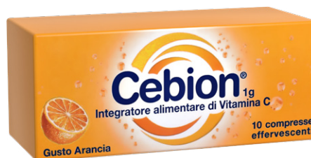
CEBION 10 compresse effervescenti gusto arancia