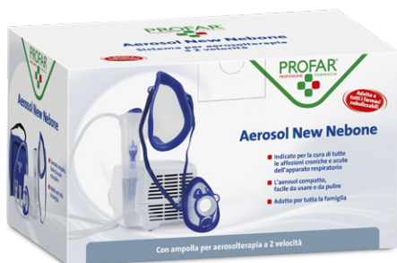
AEROSOL New Nebone